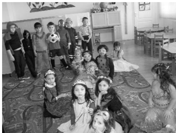
Egy kép a Farsangról