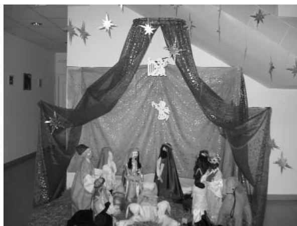
Betlehem az oviban