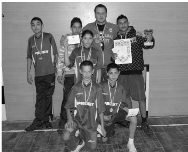
A győztes prügyi csapat

Nagyon örülünk, hogy ismét megrendezhettük a versenyt, és köszönjük a B-A-Z megyei Sportszövetség és a Községi Önkormányzat anyagi támogatását. Bízunk benne, hogy jövőre is megrendezésre kerülhet a verseny, mert a gyerekeknek felejtethetlen élményt nyújt.