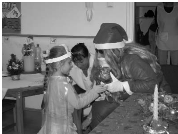
A Mikulás is járt a Mesevárban

időszaka, a farsang. Készítettünk álarcokat, jelmezeket, kiszabókat, megismerkedtünk egy-egy tájegység farsangi szokásaival. Óvodánkban farsang derekán tartjuk a télbúcsúztatót. Február 17-én vendégeink voltak a „Vidám vándorok” zenés műsorukkal és február 20-án jelmezek kavalkádjával sok-sok tréfás játékkal, tánccal „űztük el” a telet. Köszönjük minden szülőnek, adományozónak a segítséget, hogy gyermekeinknek széppé tudtuk tenni a „téli ünnepkört.”