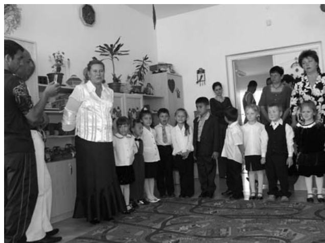
Képeink az óvoda anyák napi ünnepségén készültek