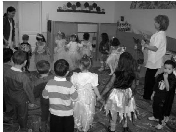
Képeink az óvodai farsangon készültek